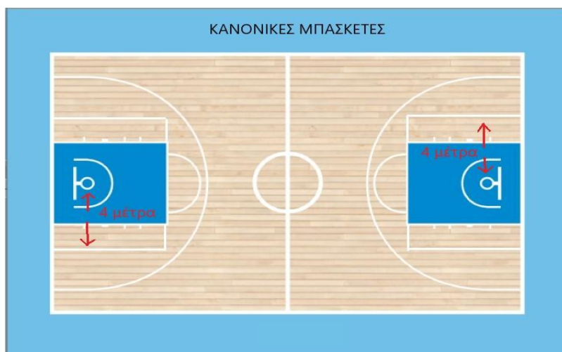
Σχήμα 2: Τετράγωνο τριπόντου